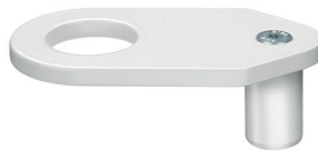
Spenderhalter für RUCK® CLAX MOBIL Art.-Nr. 11151