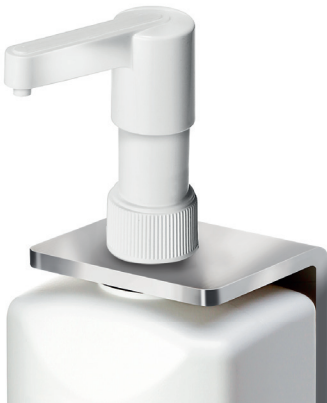
RUCK® Wandspender Art.-Nr. 29418

zur Verwendung von RUCK® Hygieneprodukten im 500 ml und 1000 ml Gebinde in Kombination mit Art.-Nr. 29418 oder Art.-Nr. 11151