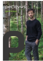
peclavus® gentleman Natürliche Körperpflege für den Gentleman