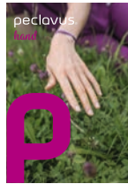
peclavus® hand Natürlich schön gepflegte Hände