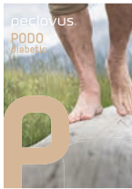
peclavus® PODOdiabetic Sanfte Pflege für sensible Füße