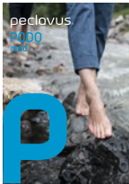
peclavus® PODOmed Wirksame Hilfe bei Fußproblemen