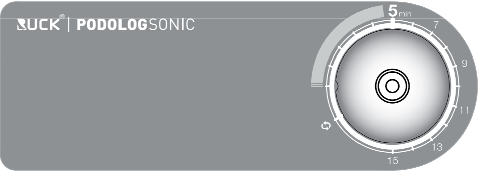
Darstellung auf dem Gerät